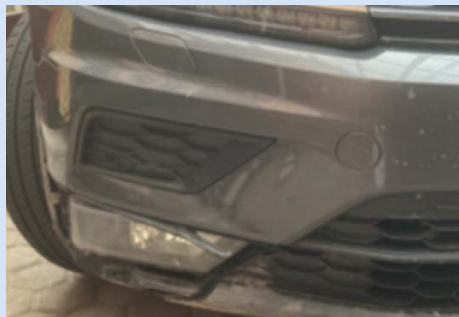
Wildschaden (Teilkasko) an einem Tiguan im Oktober 2021

Die Kosten für die Reparaturen von Fahrzeugschäden (z. B. Ersatzteile, Lohnkosten und Lackierung) sind in den letzten Jahren kontinuierlich, teilweise überproportional zur normalen Konsumgüterinflation gestiegen